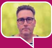
LUC VRIJWILLIGER SPRANG

“Duffel een rijke gemeente? Dat kan wel zijn, maar ook hier worden er heel wat mensen door armoede uitgesloten.”