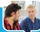
SETH EN ZENO

Fietssuggestiestroken zorgen enkel voor verwarring: voor fietsers zijn het fietspaden, voor auto's een stuk van de weg in een andere kleur. Op die manier maken ze van fietsers levende verkeersremmers. Wat nodig is, zijn echte fietspaden en conflictvrije kruispunten.