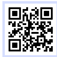
Vídeo de instrucciones del fabricante con subtítulos en español