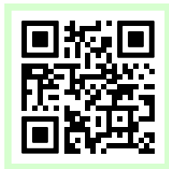
video amistoso 2SLGBTQ+