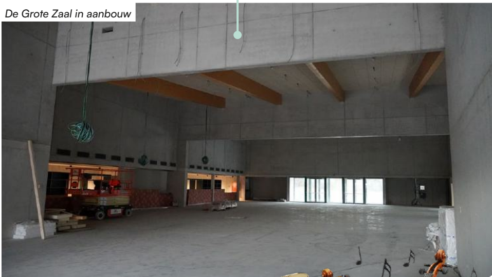
De Grote Zaal in aanbouw

Er is ook een kleinere instuifruimte voorzien die als jeugdruimte ingevuld kan worden. Klaar voor muziek, ontmoeting en ontspanning.