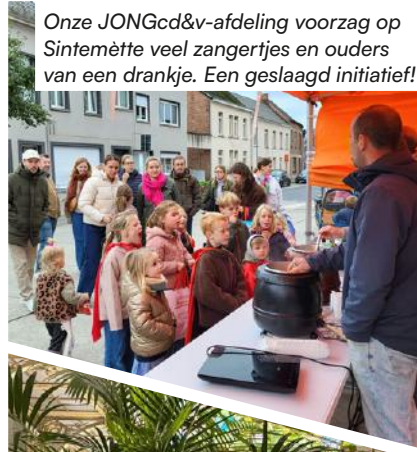
Onze JONGcd&v-afdeling voorzag op Sintemètte veel zangertjes en ouders van een drankje. Een geslaagd initiatief!