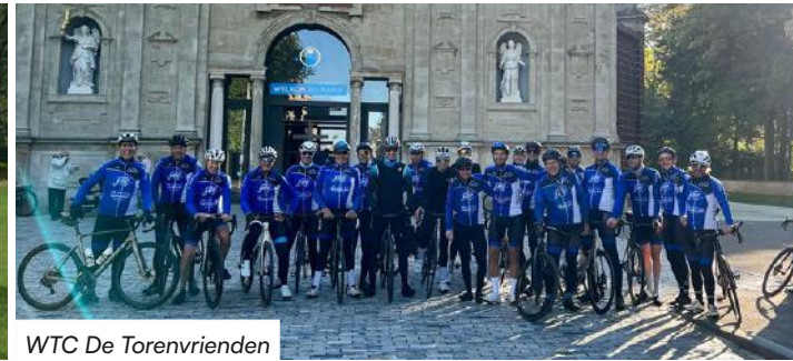
WTC De Torenvrienden