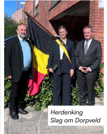
Herdenking Slag om Dorpveld