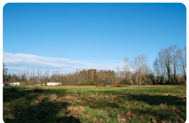
Perceel parking Grasheide

Met deze beslissing tonen we opnieuw dat CD&V Putte verder kijkt dan vandaag. We investeren niet alleen in stenen of parkeerplaatsen, maar in een kwalitatieve publieke ruimte waar veiligheid, samenhang en leefbaarheid centraal staan. Grasheide verdient een dorpsplein dat klaar is voor de toekomst — en daar werken wij stap voor stap aan.