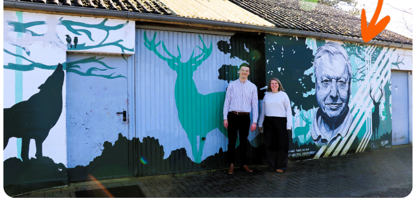
Locatie van de fietsbieb aan het dienstencentrum 'Het Lijsternest'

CD&V gaat voor de oprichting van een fietsbieb en het voeren van een actief fietsbeleid.