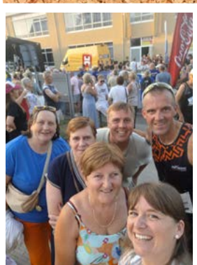
Veel (en schoon?) volk langs het parcours tijdens de Corrida en het wielerkampioenschap...