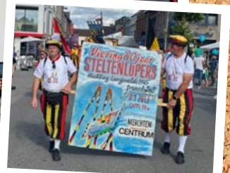
De Steltenlopers vierden hun 80-jarig bestaan met een spetterende praalstoet. Samen met hun vele bevriende verenigingen trakteerden ze het talrijke publiek op een waar visueel spektakel. Bedankt voor dit heerlijke verjaardagscadeau!