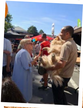
Ook Sammy Mahdi, de nationale voorzitter van cd&v, bracht een bezoek aan de jaarmarkt. Hier ziet u hem omringd door enkele prijsbeesten... en door enkele van zijn sympathisanten.