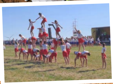
Het Landjuweel streek neer in Merchtem. Onze Merchtemse KLJ organiseerde dit enorme sportieve evenement, ontving meer dan 3000 jongeren, en maakte er een fantastisch feest van—het was een prachtig schouwspel. Chapeau!