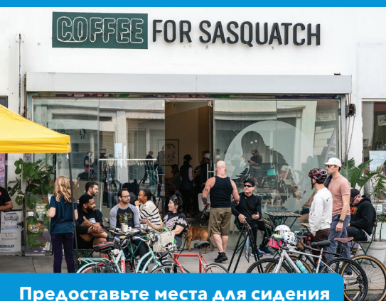
Предоставьте места для сидения

Свяжитесь с нами по почте info@ciclavia.org или телефону 213.355.8500 .