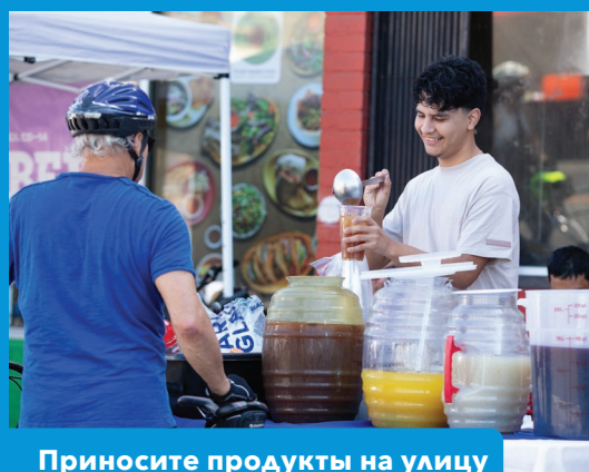
Приносите продукты на улицу