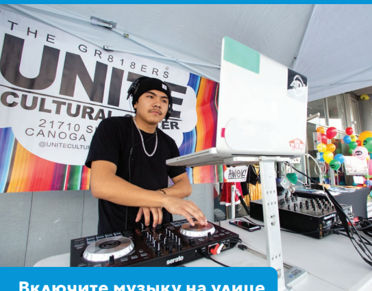
Включите музыку на улице