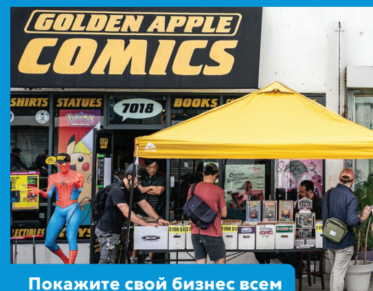
Покажите свой бизнес всем