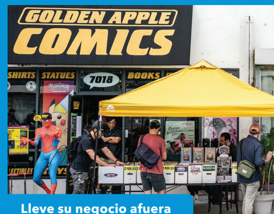
Lleve su negocio afuera