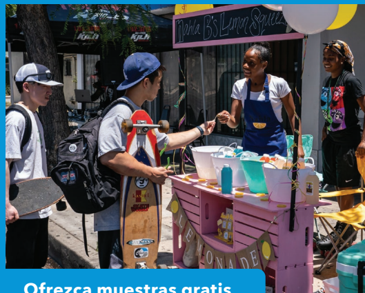
Ofrezca muestras gratis