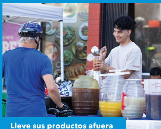
Lleve sus productos afuera