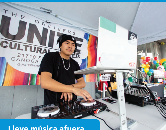
Lleve música afuera