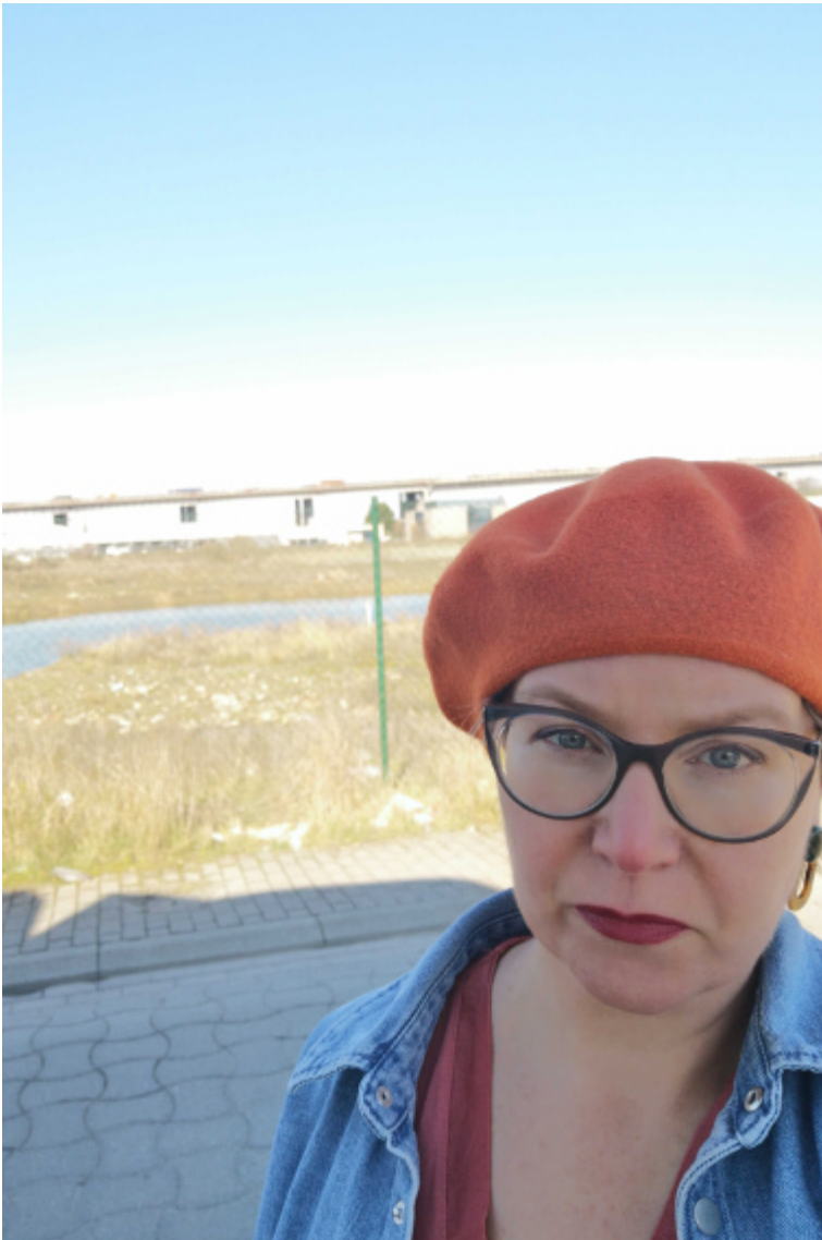
Vilvoorde houdt haar beslissing om de goedkeuring aan te vechten, in beraad.