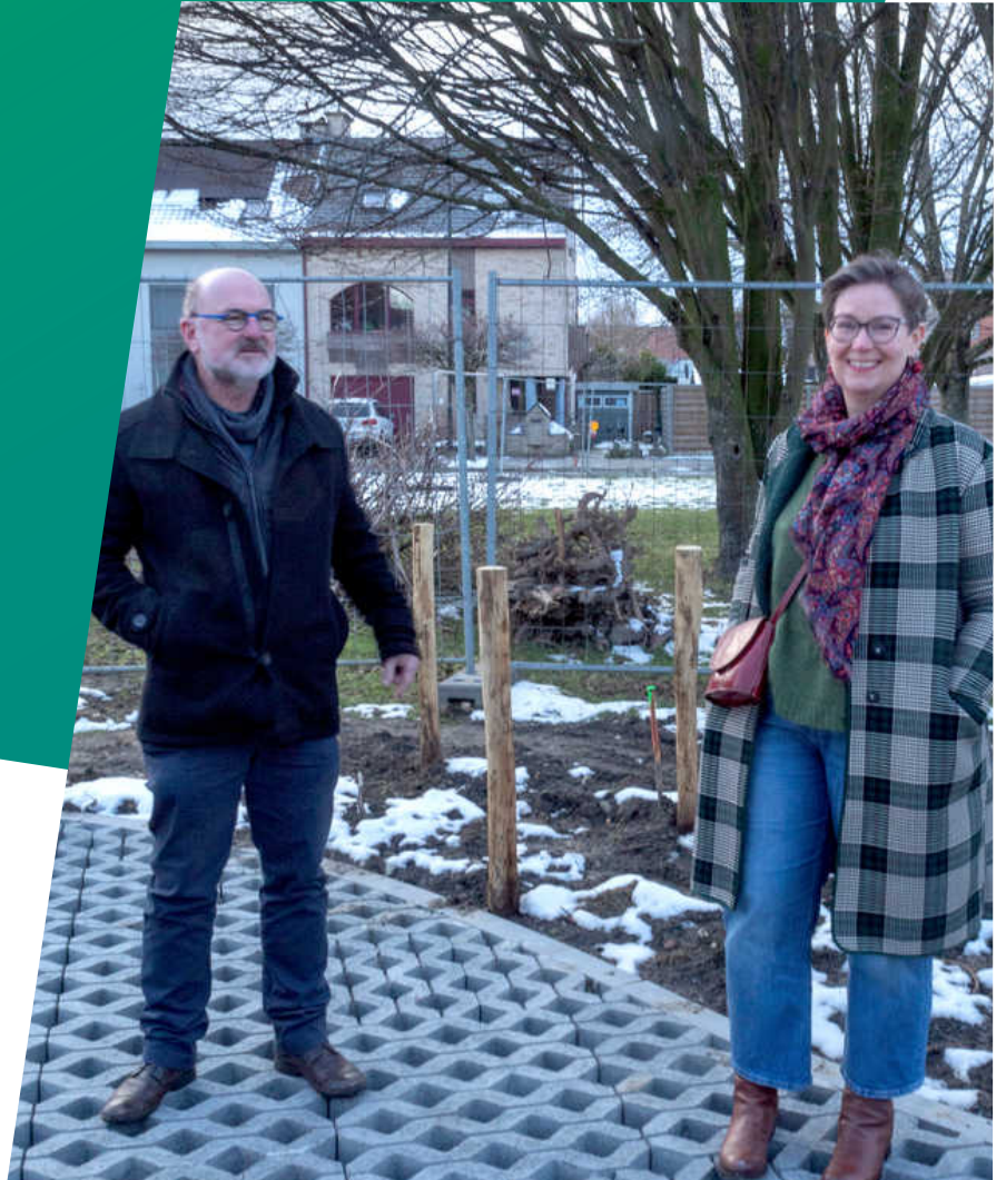
De Wilgenstraat op 't Far West: een mooi nieuw pleintje en de eerste klimaatstraat van Vilvoorde.

‘Na twee jaar maken we de balans op van de groene en sociale verwezenlijkingen waar we trots op kunnen zijn’