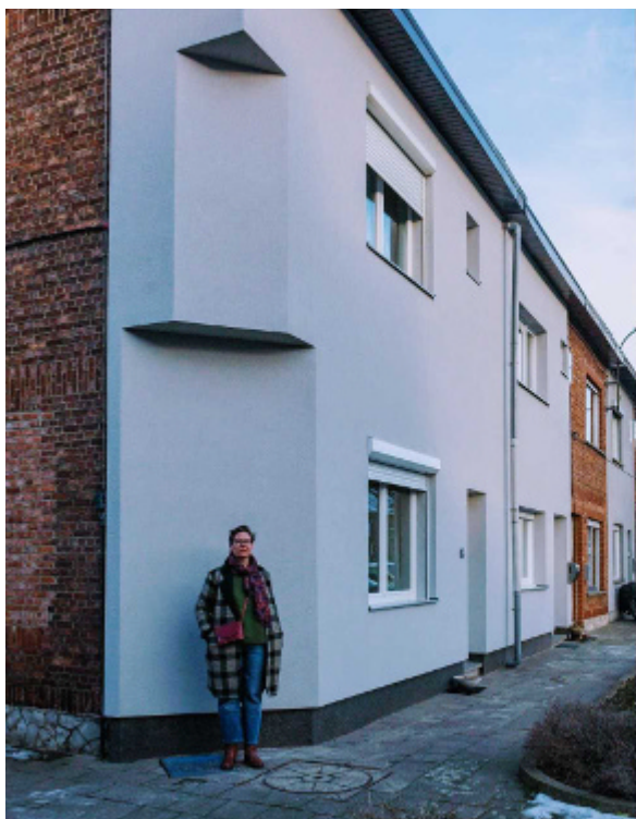
Nu en vroeger: in het Broek komt de renovatiemotor op gang dankzij het beleid van de stad.