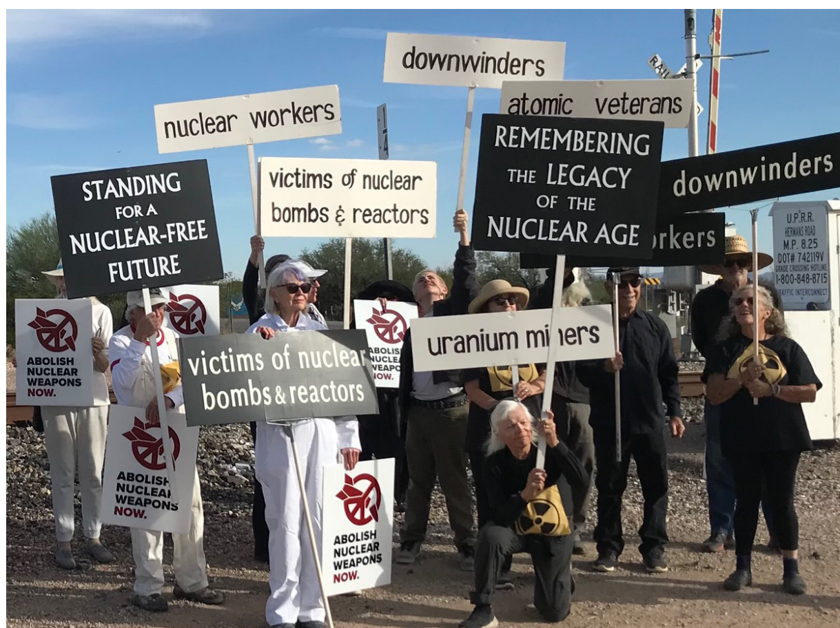
Manifestanti antinucleari nello stato dell'Arizona, USA.

Molte comunità in tutto il mondo affrontano ancora oggi sfide legate allo stoccaggio sicuro e protetto delle enormi quantità di rifiuti nucleari accumulate dalla produzione di decine di migliaia di armi nucleari dal 1945. Rimarranno pericolosi per millenni.