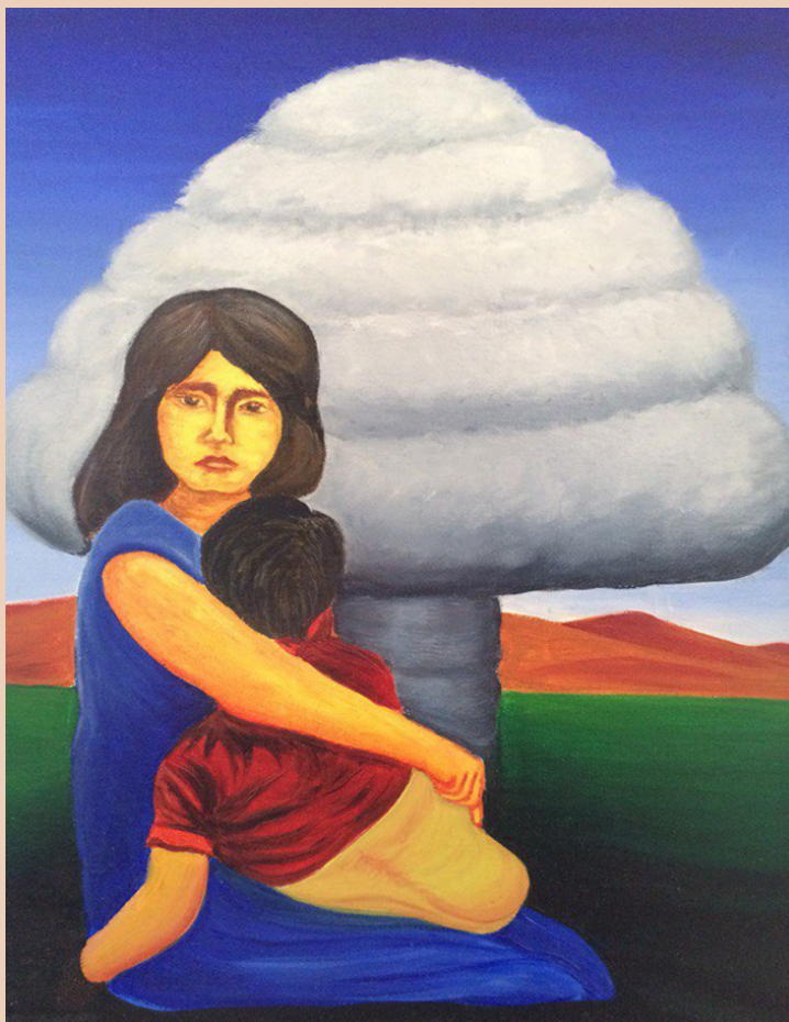
Una delle opere di Karipbek Kuyukov, intitolata "Fear"

Dal 1949 al 1989, l'Unione Sovietica condusse più di 450 esplosioni di test nucleari a Semipalatinsk, quasi un quarto di tutti i test a livello globale.