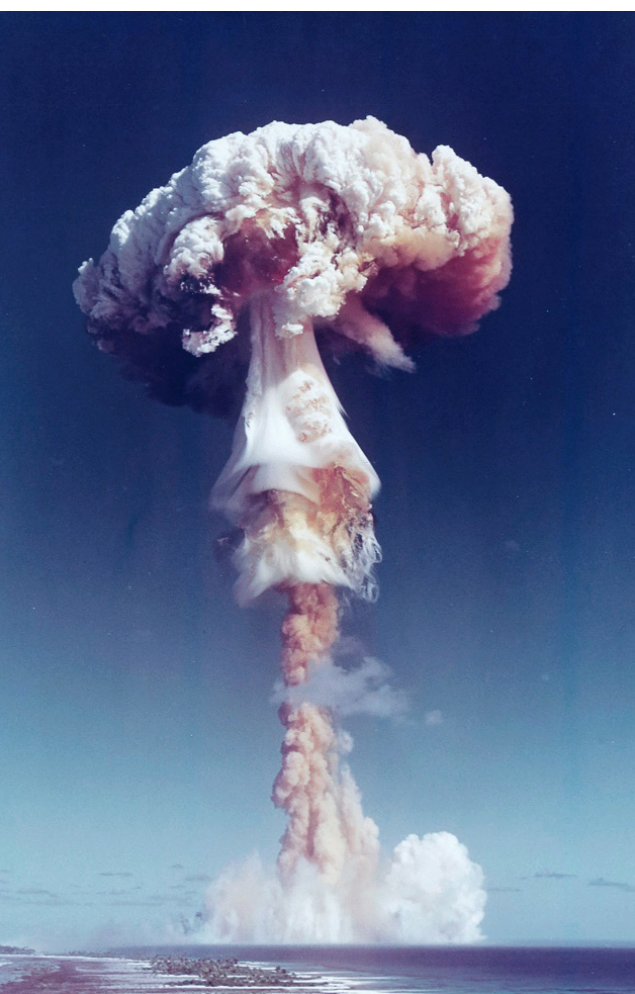
Un test nucleare francese nell’atollo di Moruroa, Mā’ohi Nui, nel 1971.

L’eredità tossica dei test nucleari ha fatto sì che molte comunità si siano disconnesse dal proprio stile di vita tradizionale, impossibilitate a tornare nei siti ancestrali o a vivere della terra e delle acque come avevano fatto per secoli.