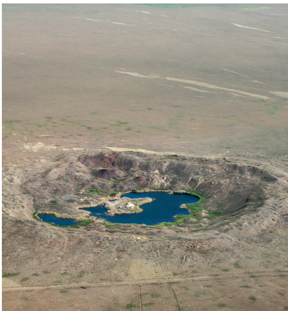
Un cratere formato da un test nucleare sovietico in Kazakistan.