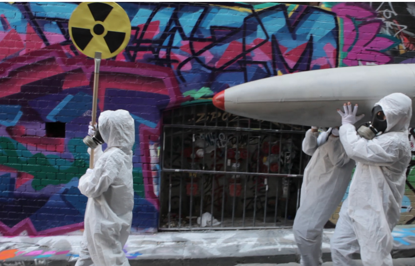
Un'azione antinucleare a Melbourne, Australia.

Oggi è necessaria un'azione ancora più diretta.