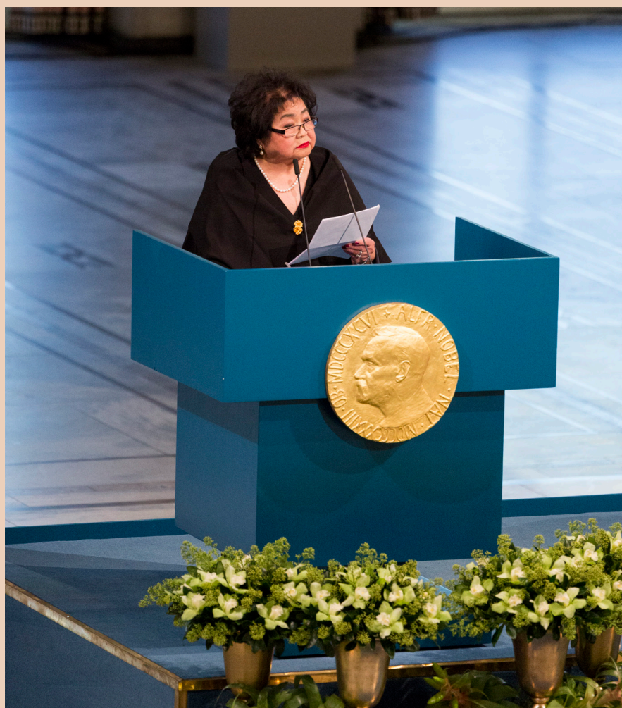
Setsuko Thurlow alla cerimonia del Premio Nobel per la Pace in Norvegia nel 2017.

Ha esortato i leader mondiali a firmare il Trattato sulla proibizione delle armi nucleari: “Che questo sia l'inizio della fine delle armi nucleari. Unitevi a questo trattato; eliminate per sempre la minaccia dell'annientamento nucleare”.