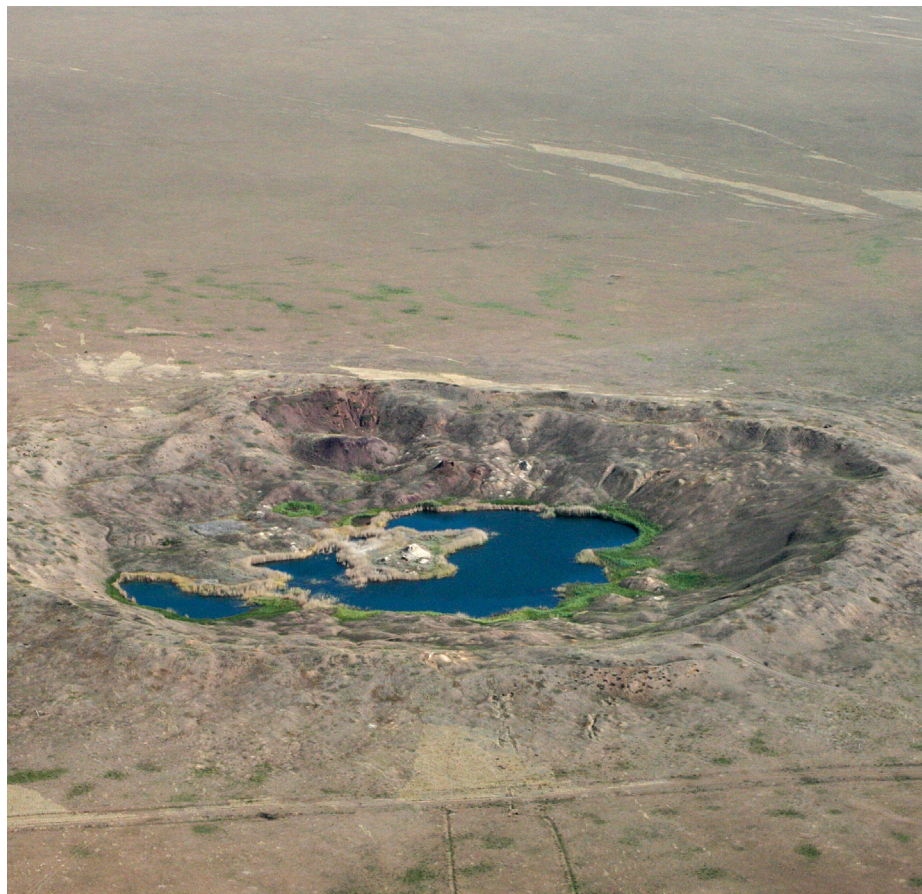
Sebuah kawah terbentuk akibat ledakan uji coba nuklir Soviet di Kazakhstan.