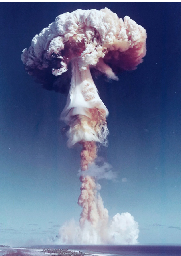
Ledakan uji coba nuklir Perancis di Atol Moruroa di Mā'ohi Nui pada tahun 1971.

Warisan beracun dari uji coba nuklir telah menyebabkan banyak komunitas terputus dari cara hidup tradisional mereka, tidak mampu kembali ke situs leluhur atau bertahan hidup dari tanah dan perairan seperti yang telah mereka lakukan selama berabad-abad.