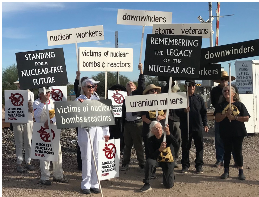
Para demonstran anti-nuklir di negara bagian Arizona, AS.

Banyak komunitas di seluruh dunia juga terus menghadapi tantangan terkait dengan penyimpanan yang aman dan terjamin untuk limbah nuklir dalam jumlah besar yang terkumpul dari produksi puluhan ribu senjata nuklir sejak tahun 1945. Hal ini akan tetap berbahaya selama ribuan tahun.