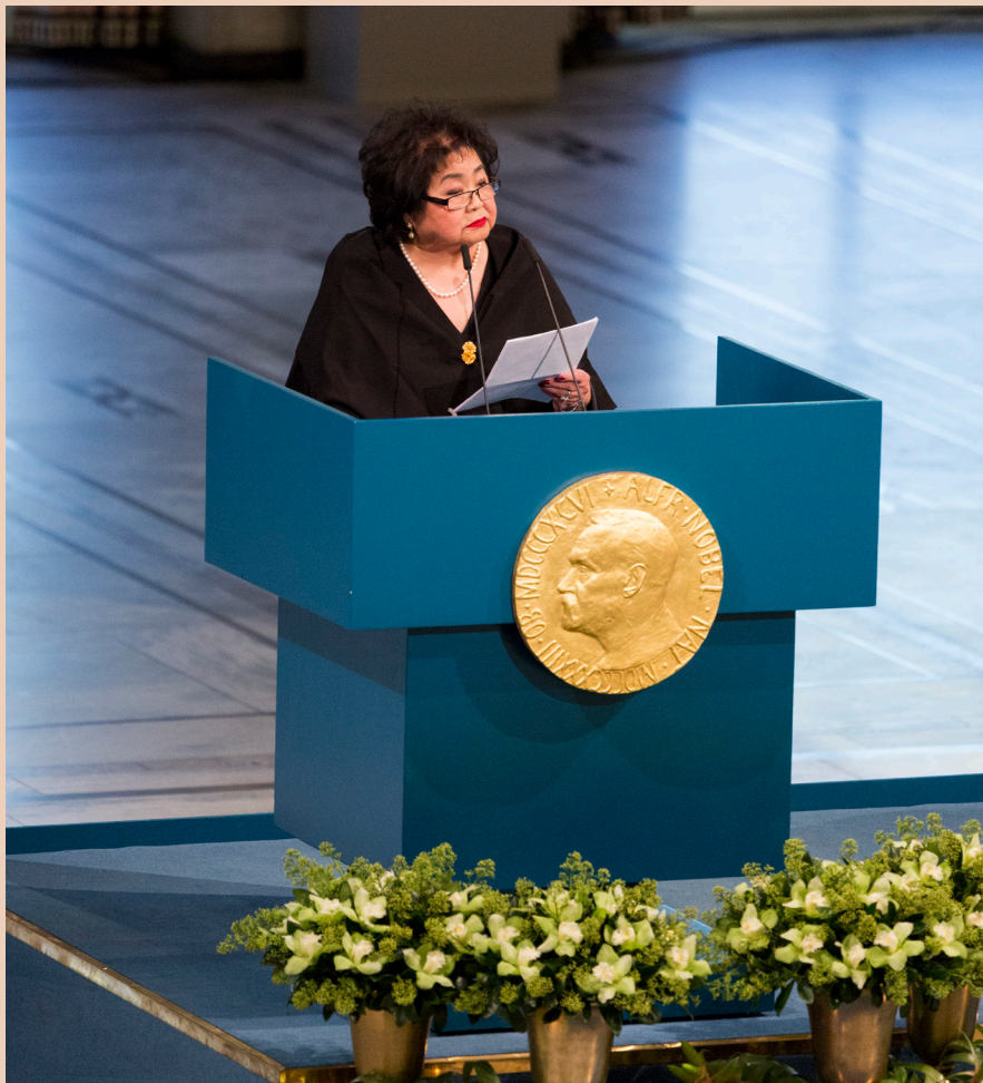
Setsuko Thurlow di upacara Penghargaan Nobel Perdamaian di Norwegia pada tahun 2017.

Ia mendesak para pemimpin dunia untuk menandatangani Traktat Pelarangan Senjata Nuklir yang baru saja diadopsi. “Biarlah ini menjadi awal dari akhir senjata nuklir,” katanya. “Bergabunglah dengan perjanjian ini; hapus ancaman pemusnahan oleh senjata nuklir untuk selamanya.”