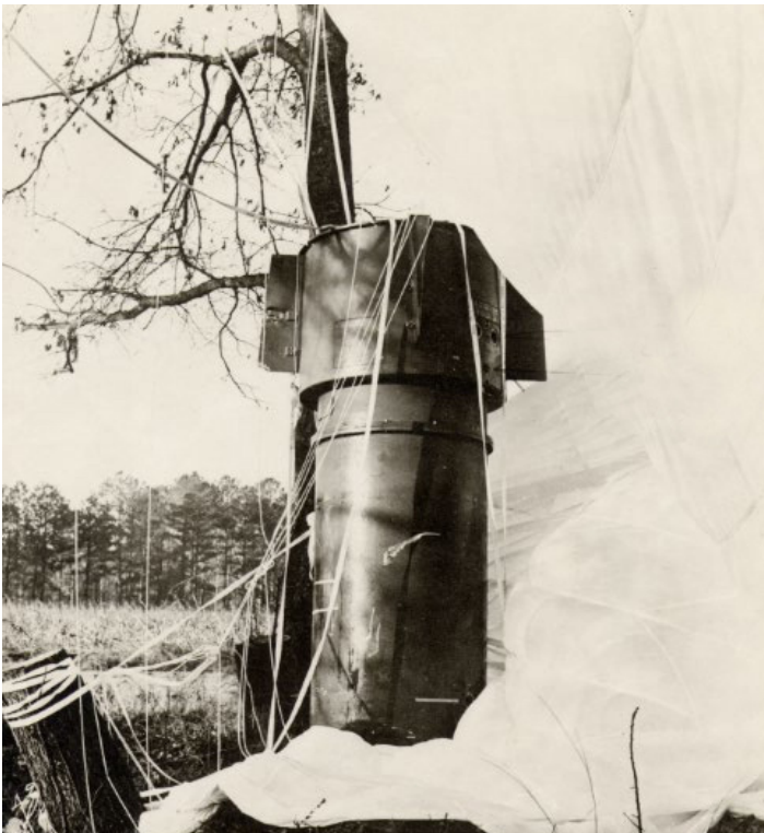
1961년 미국 노스캐롤라이나주에서는 폭격기의 날개 하나가 떨어져 나가면서 핵폭탄 두 발이 지상으로 추락했다. 당시 미국 국방장관 로버트 맥나마라는 “아주 근소한 우연의 차이, 두 가닥의 전선이 교차하지 않은 덕분에 핵폭발이 피할 수 있었다”고 말했다.

그 외에도 핵무기가 바다에서 유실된 사건, 핵무장을 한 잠수함끼리 충돌한 사건, 새 떼나 구름에 반사된 빛이 핵탄두 탑재 미사일로 오인된 사건, 그리고 훈련용 테이프가 실수로 실제 운용 중인 컴퓨터에 삽입되어 핵 공격이 발생한 것으로 판단한 사건 등, 우려스러운 사례들이 여러 차례 있었다.