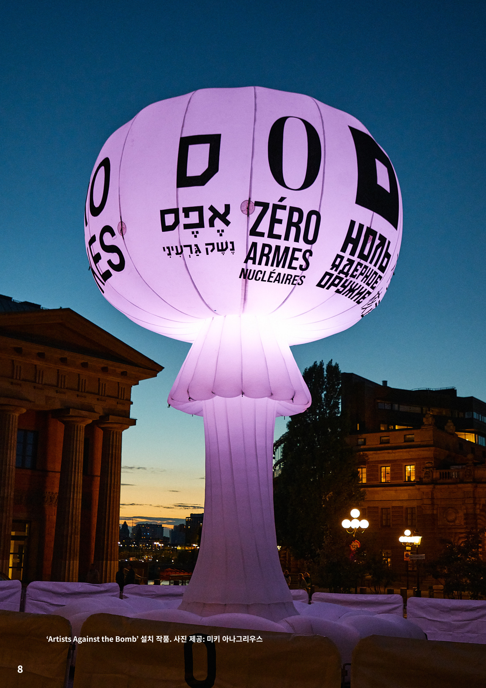
'Artists Against the Bomb' 설치 작품.