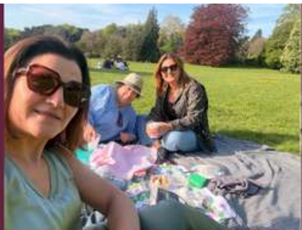
Picknick met de vriendinnen in het Park van Laken