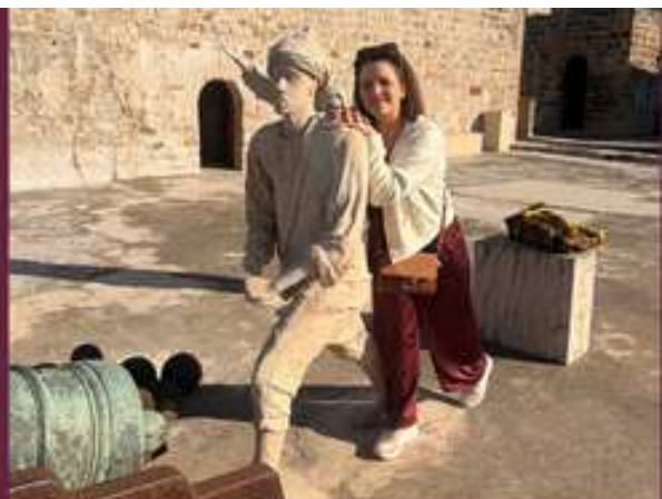
Terug naar het land van mijn moeder, waar ze ook begraven werd