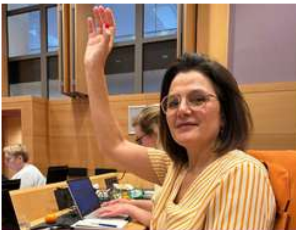
De pensioenhervorming goedkeuren in commissie