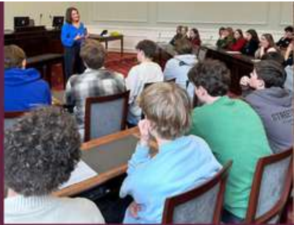
Mater Salvatorisinstituut op bezoek in de Kamer