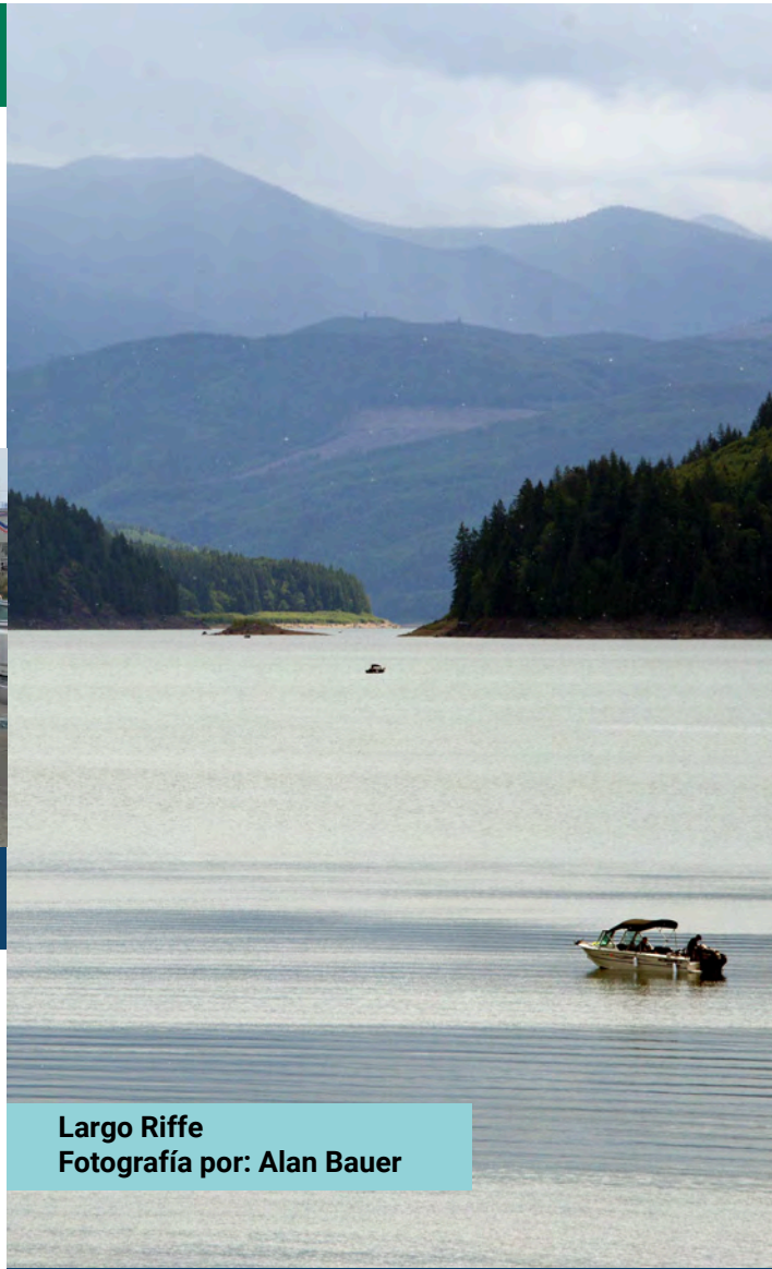
Largo Riffe

Escanee el código QR para ver más información.