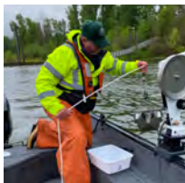
Toma de muestras bénticas con una draga ponar.

Las plantas acuáticas importadas, como las bolas de musgo, pueden estar infestadas con especies acuáticas invasivas y entrar a nuestras vías fluviales debido a su disposición incorrecta. Siempre siga las directrices para disponer de ellas correctamente.