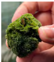
Mejillón cebra en una bola de musgo Marimo.