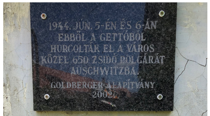
On peut lire sur cette plaque : "Les 5 et 6 juin 1944, de ce ghetto ont été déportés vers Auschwitz en marche forcée, 650 juifs" Fondation Golberger 2002.

Elle nous avait envoyé une lettre et le discours qu'elle avait déclamé au président de la république de l'époque en inaugurant une partie du musée d'Izieu.