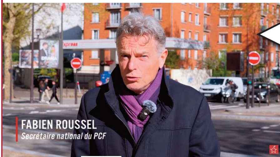
FABIEN ROUSSEL Secrétaire national du PCF