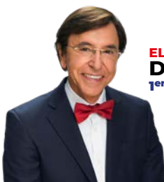
ELIO DI RUPO 1 er effectif